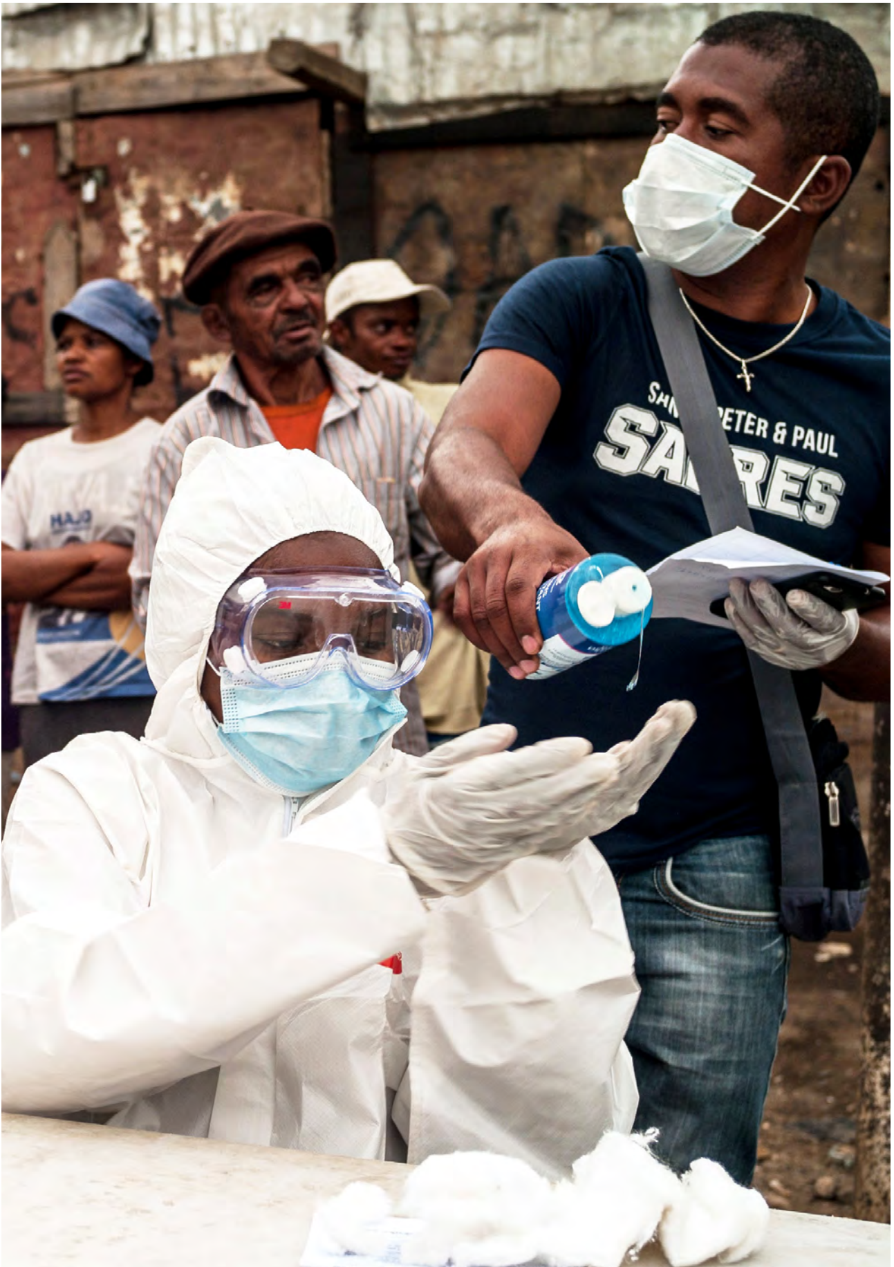
Une agente de santé vêtue d'un équipement de protection individuelle, à Madagascar. La pandémie de COVID-19 a mis à rude épreuve le système de santé du pays, notamment sa capacité à lutter contre d'autres maladies comme le VIH, la tuberculose et le paludisme.