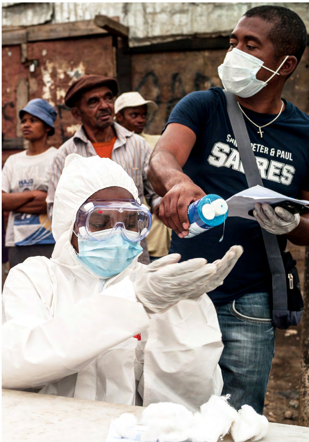
Une agente de santé vêtue d'un équipement de protection individuelle, à Madagascar. La pandémie de COVID-19 a mis à rude épreuve le système de santé du pays, notamment sa capacité à lutter contre d'autres maladies comme le VIH, la tuberculose et le paludisme.