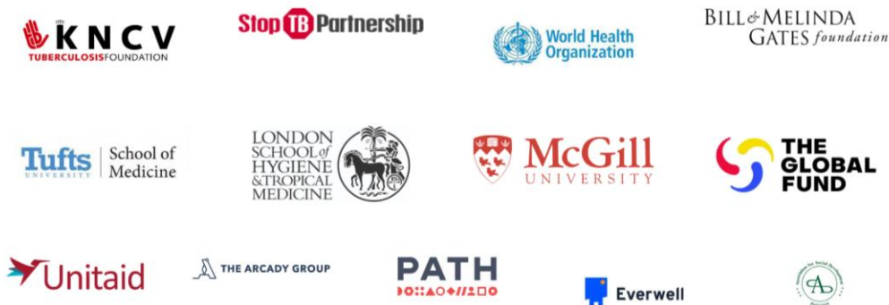
Imagen: Organizaciones colaboradoras del Grupo de trabajo mundial sobre DAT

Si necesita orientación para el desarrollo de propuestas de financiación de DAT, la introducción o la ampliación de las intervenciones de DAT, la investigación, o el desarrollo de presupuestos y la planificación de recursos a corto y largo plazo, póngase en contacto con el Grupo de trabajo mundial sobre DAT .