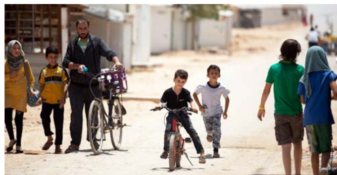
Camp de réfugiés syriens de Za'atari en Jordanie.