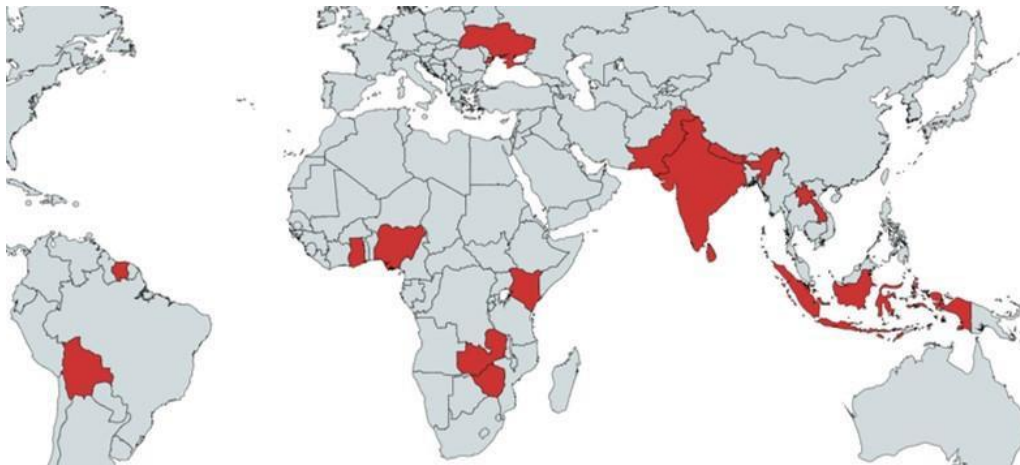
Figure 1 : Origine géographique des allégations de fraudes et d'abus salariaux déclarées au BIG, 2016-19

Depuis 2016, le Bureau de l'Inspecteur général a reçu 33 allégations distinctes de fraudes et d'abus salariaux affectant les subventions du Fonds mondial. Les rapports sont de plus en plus nombreux et 26 allégations ont été reçues au cours des deux dernières années. Le BIG a évalué l'ensemble de ces allégations en s'appuyant sur des critères qui déterminent leur crédibilité et leur gravité, ce qui a donné lieu à différents résultats dont notamment l'ouverture de dossiers pour enquête plus approfondie, la supervision du travail d'enquête entrepris par les parties prenantes et la transmission des affaires au Secrétariat du Fonds mondial à des fins d'information et d'atténuation des risques. Un petit nombre d'allégations ont donné lieu à l'ouverture d'enquêtes complètes qui ont été soit menées, comme celles décrites dans le présent rapport, soit clôturées. Des allégations ont été reçues en provenance de 14 pays, dont 11 allégations distinctes venant du seul Nigéria et cinq d'Indonésie, ce qui a déclenché les récentes missions d'enquête dans ces deux pays (telles que décrites en détail dans les constatations 2.2 et 2.3).