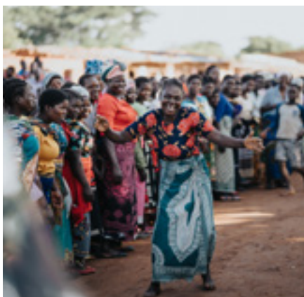
Dans le district de Dedza, au Malawi, les résidents célèbrent l'ouverture d'une nouvelle clinique. Désormais, ils n'auront plus à parcourir 15 kilomètres pour atteindre la structure de santé la plus proche.

Le Fonds mondial intensifie la collaboration dans l'ensemble de l'écosystème, en particulier avec les organisations telles que Gavi, l'Alliance du Vaccin, l'Organisation mondiale de la Santé et Unitaïd, en coordonnant la coopération avec les pays, en co-investissant dans les systèmes de santé et en promouvant le partage des services opérationnels. Nos partenariats avec la Banque mondiale, les institutions régionales telles que l'Union africaine et le secteur privé renforcent également les financements, la résilience des systèmes de santé et l'innovation. Dans l'ensemble, nous cherchons à réformer en visant la complémentarité, la réduction des duplications et le renforcement du leadership des pays, afin d'ériger un système de la santé mondiale plus cohérent, efficace et équitable.