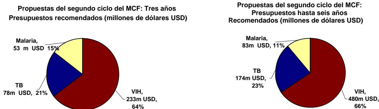
Figura 2 – Recomendaciones del PRT para el segundo ciclo del MCF

3. En la Figura 3 a continuación se presenta una comparación entre el Ciclo 1 y el Ciclo 2 del MCF. Se comparan el número de propuestas financiadas y los montos máximos aprobados para la Fase 1 (tres años) y para la duración de la propuesta (seis años). Como se puede observar, se recomendaron cinco propuestas en el primer ciclo frente a seis en el segundo ciclo pero el importe total recomendado triplica prácticamente en el segundo ciclo.