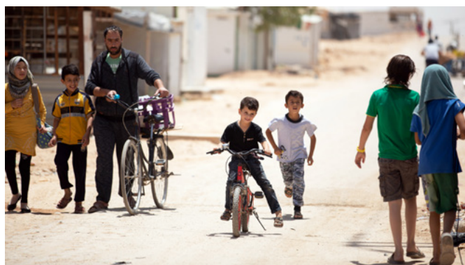
Campo de Za'atari para refugiados sirios (Jordania).

En noviembre de 2020, el Banco de Desarrollo KfW, en representación de Alemania, y el Gobierno de Jordania firmaron un acuerdo de D2H en virtud del cual se convirtieron 10 millones EUR de créditos de ayuda oficial al desarrollo para apoyar a los refugiados sirios en Jordania a través del programa de Respuesta de Oriente Medio del Fondo Mundial. Este canje de deuda aumentó los recursos disponibles para el diagnóstico, la vigilancia y la contratación de personal dedicado a la tuberculosis, y permitió ofrecer formación adicional a los profesionales médicos y actores comunitarios, financiar equipos y personal de laboratorio (lo que mejoró la preparación y respuesta frente a otras enfermedades endémicas como el VIH y la tuberculosis) y reforzar el sistema de información sobre la gestión sanitaria de Jordania, del cual depende la coordinación y la gestión estratégica nacional y es esencial para la notificación puntual y la vigilancia de brotes de enfermedades.